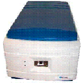
ScanArray Gx von PerkinElmer

Die Genedia AG in Kooperation mit Perkin Elmer laden Sie zur Teilnahme an einem Array -basierten Comparative Genomic Hybridisation (CGH-) Applikationsseminar in München ein.